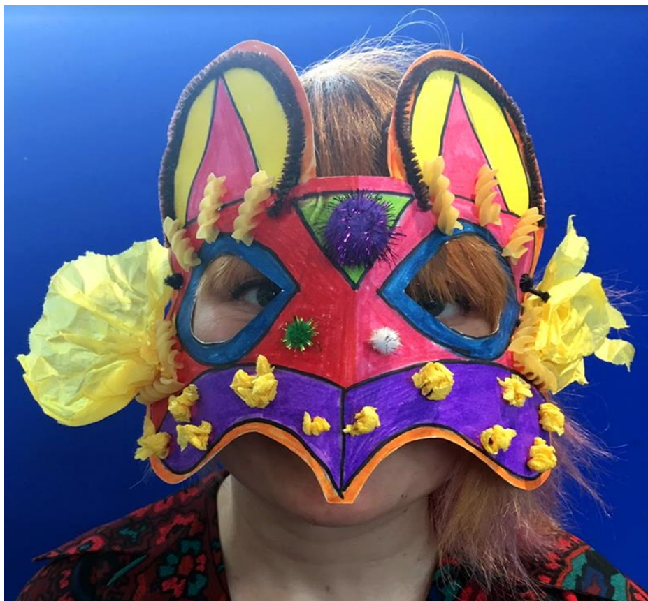
Maschera ispirata al carnevale di Venezia, Fotografia di June Bianchi